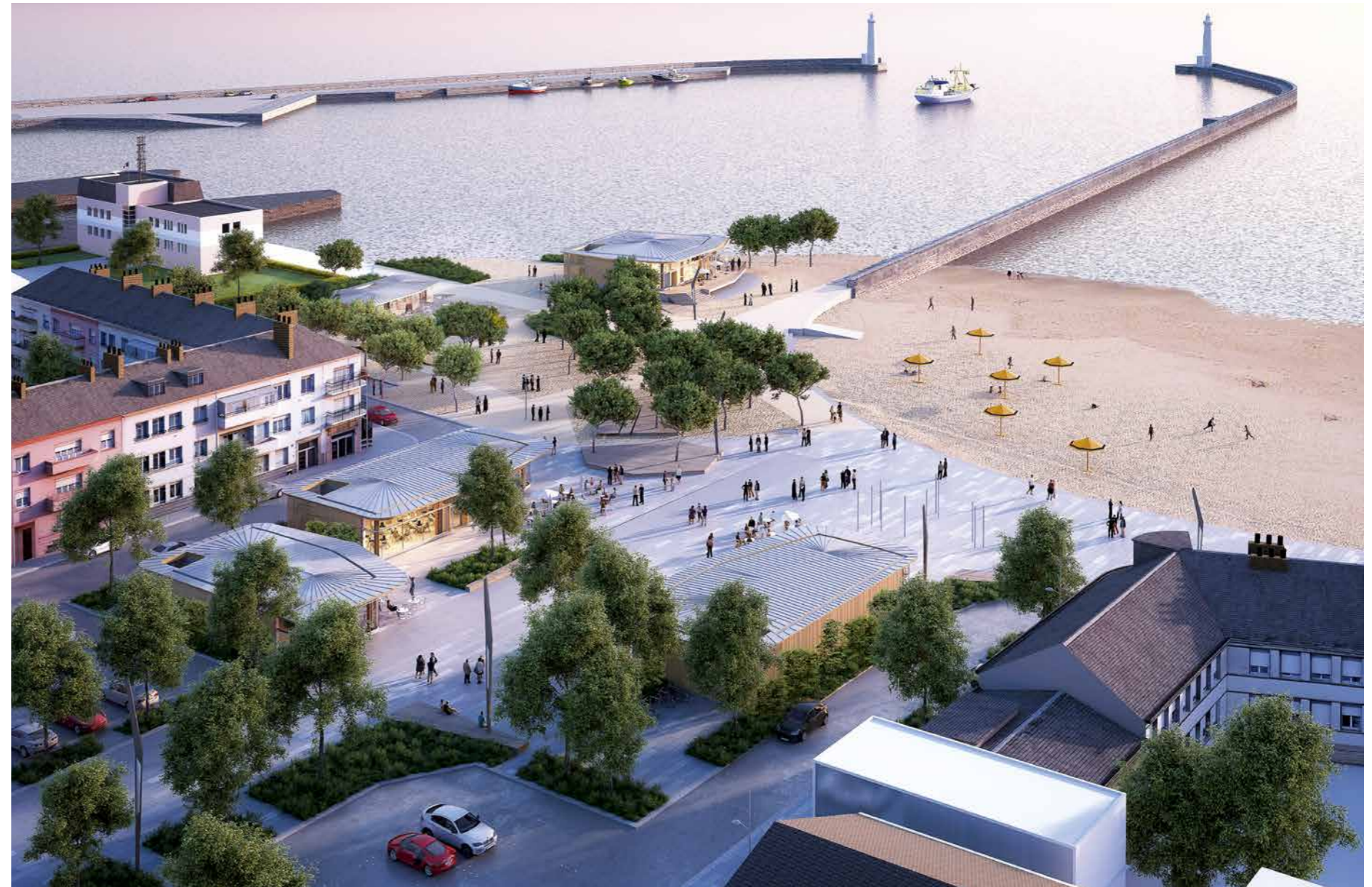
Vue aérienne de la place du Commando à Saint-Nazaire, ouverture 2018.