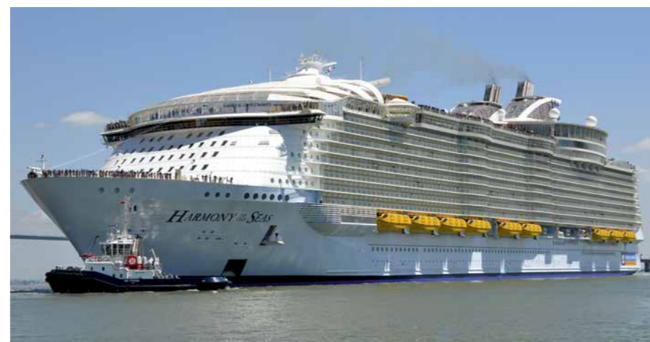
Départ du paquebot Harmony of the Seas

Parallèlement, portant le regard vers l'avenir afin de saisir les opportunités et de préparer demain, le territoire nazairien a su investir dans les EMR. Un secteur qui est aujourd'hui une réalité industrielle, au point d'être désormais un des piliers de l'économie maritime de Saint-Nazaire. ●