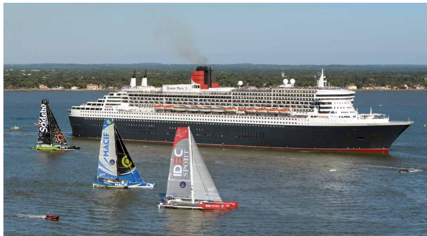
Le Queen Mary 2 au départ de la course « The Bridge »