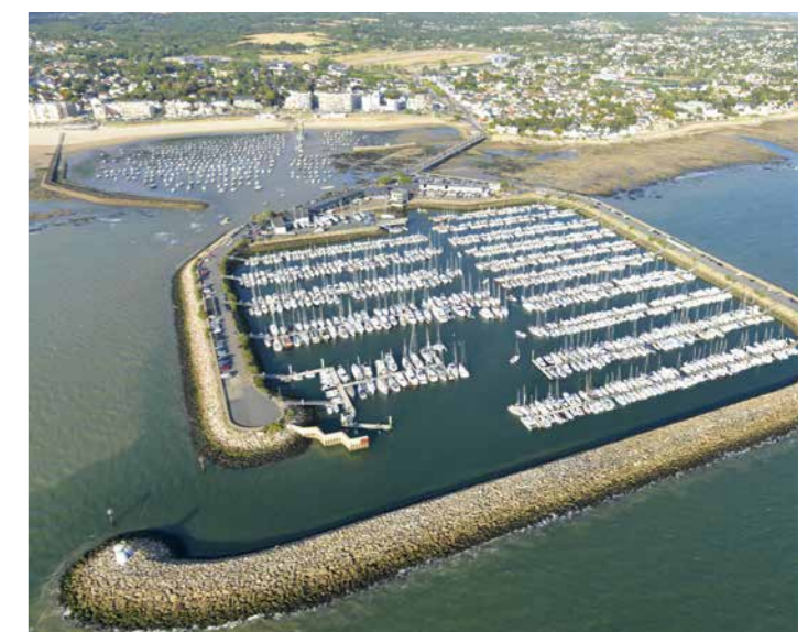
Vue aérienne de Pornichet