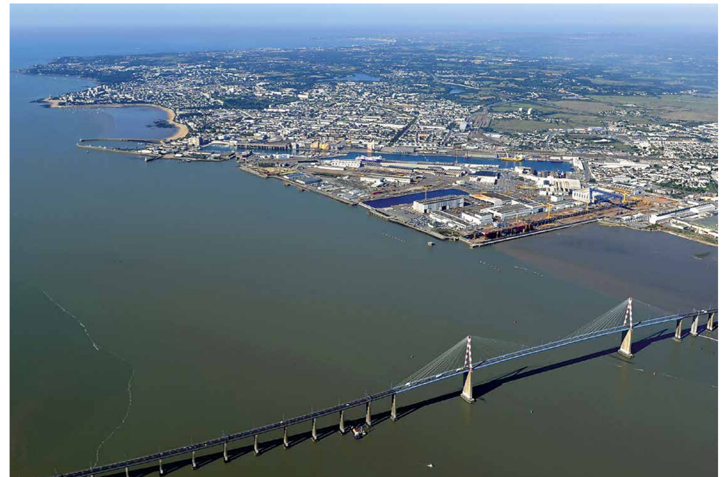
Port de Saint-Nazaire

La transition énergétique et écologique est une réalité multiple sur l'estuaire, avec la coopération des acteurs publics et privés. Elle se traduit notamment par la gestion d'espaces naturels, dont Nantes Saint-Nazaire Port est propriétaire, sur lesquels nous développons progressivement des plans de gestion et actions en faveur de la biodiversité (Donges-Est, Bouguenais, Le Carnet). Nous mettons également en œuvre des actions visant à réduire l'impact environnemental de l'activité portuaire : remotorisation au GNL de la drague Samuel de Champlain, démarche d'écologie industrielle et développement des modes massifiés de transport. On peut donner l'exemple de FlexiLoire, un service de transport fluvial de marchandises créé dès janvier prochain sur l'estuaire, avec la coopération de Nantes Métropole et Saint-Nazaire Agglomération.