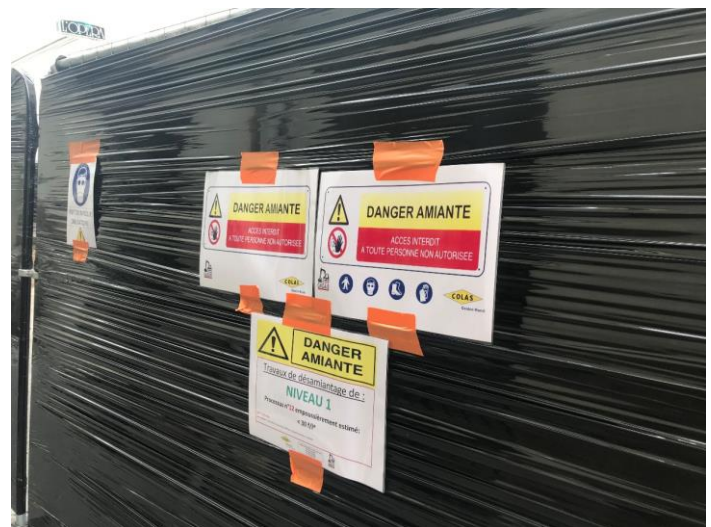
Exemple d'un affichage sur le danger de l'amiante apposé sur une clôture de chantier