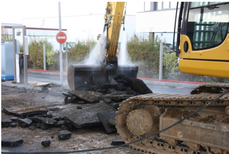
Exemple d'une pelle à chenilles équipée d'une cabine pressurisée et d'une rampe de brumisation pour retirer un enrobé amianté