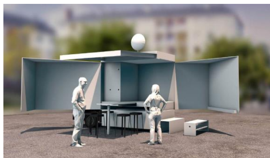
Un outil né d'une réflexion collégiale. L'équipe de l'Atelier a piloté la réflexion et la mise en place de ce nouvel Atelier mobile. Ses propositions ont été validées par un jury composé d'élus, de membres de conseils citoyens de quartiers et de techniciens.